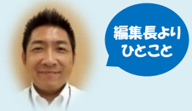
編集長より ひとこと

皆様こんにちは 2回目にして編集長を拝命しました。更なる内容の充実を目指して頑張ります！