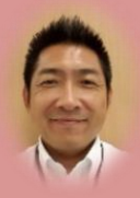
編集長よりひとこと

お祭りが終わりましたね。皆さんのお祭りは如何でしたか？私の自宅は西条市、勤務は新居浜市ですので、残念ながら今年も仕事で不参加でした。